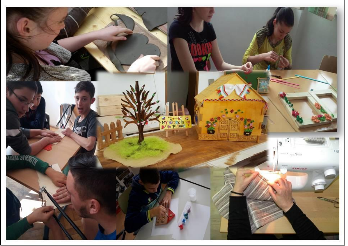
(CSEI „Alexandru Rosca” Lugoj, Romanya- öğrencilerin uğraş terapisi çalışmaları)