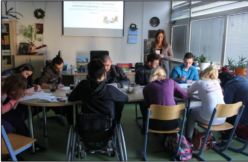
CV hazırlama – Hırvatistan