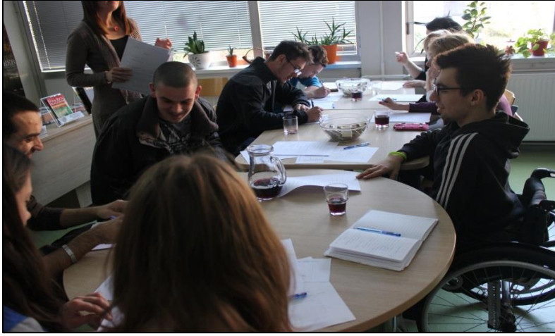
İş başvurusu çalışmaları – Hırvatistan