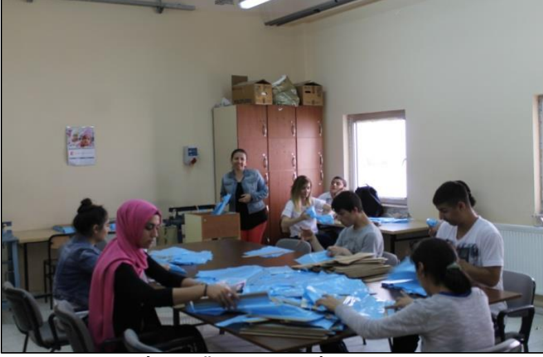
Galof atölyesi-İzmir Özel Eđitim İř Uygulama Merkezi