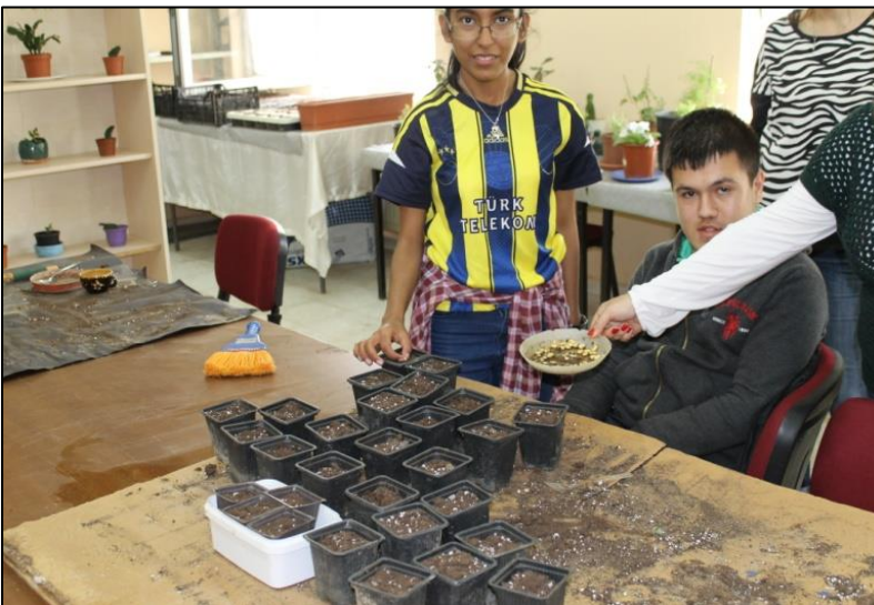
Tarım atölyesi- İzmir Özel Eđitim İř Uygulama Merkezi