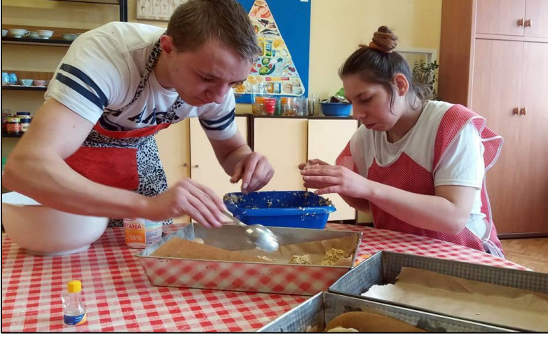
Yiyecek içecek hazırlama-Polonya