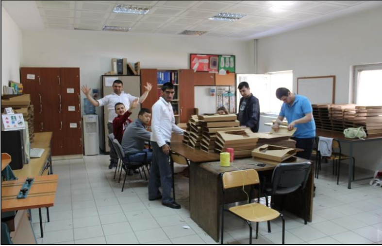
Karton kutu katlama-matbaa atölyesi- İzmir Özel Eđitim İř Uygulama Merkezi