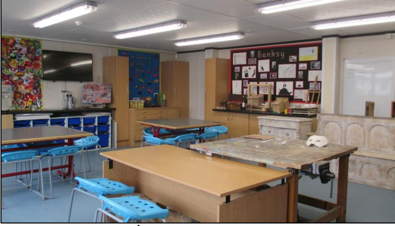
Aaç iřleri atölyesi-İngiltere