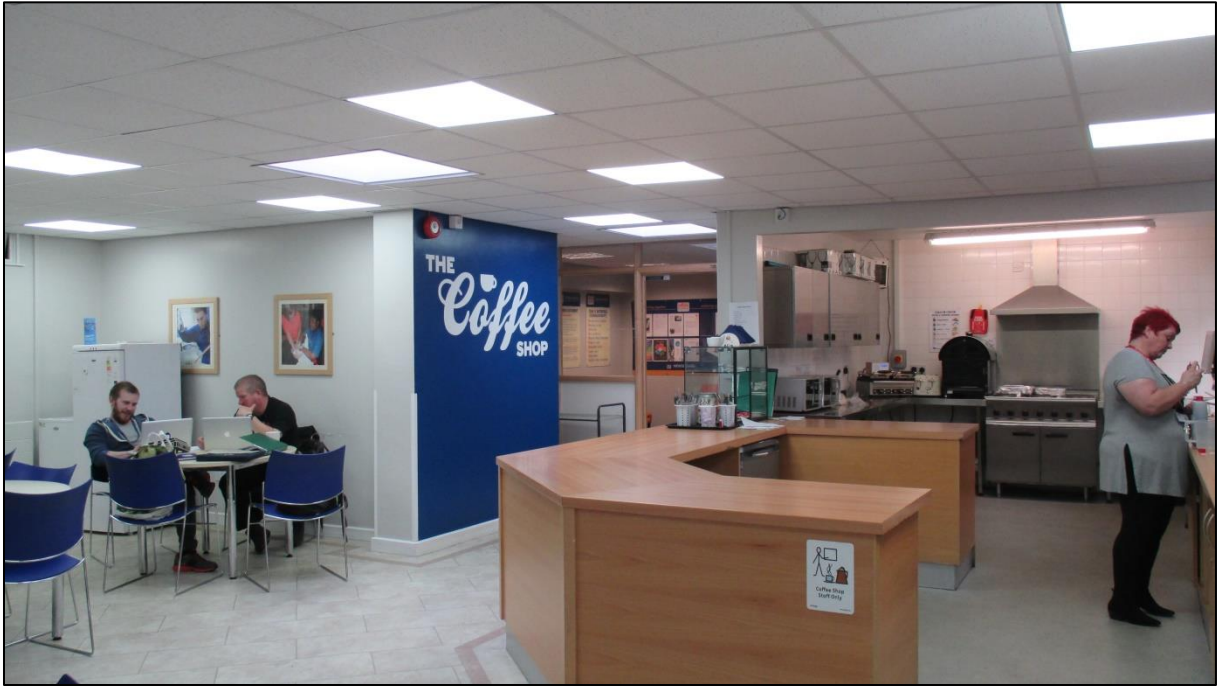
Kafeteryamız – Okul bünyesinde kurduğumuz küçük işletmemiz (Catcote Academy, Hartlepool, UK)

Yerel topluma ulaşma ve öğrencilerimizin yeteneklerini potansiyel işverenlere sergileme konusunda çabalarımız oldukça iyi sonuçlar verdi. Kısa süre içinde Hartlepool'un merkezinde öğrencilerimiz tarafından hazırlanan bir dizi ürün satacak yeni mağazamız 'Catcote Metro'yu açacağız.