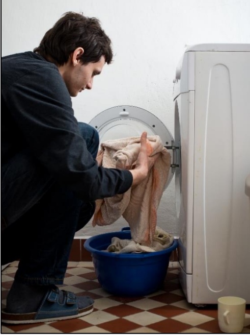
Günlük yaşam becerileri-Slovakya